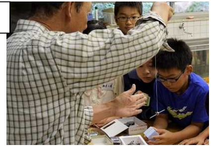
磁石の仕組みと工夫